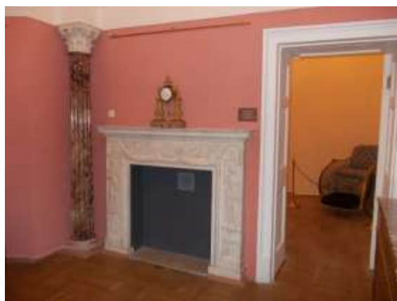
Илл. 14. Отдыхательная комната с камином