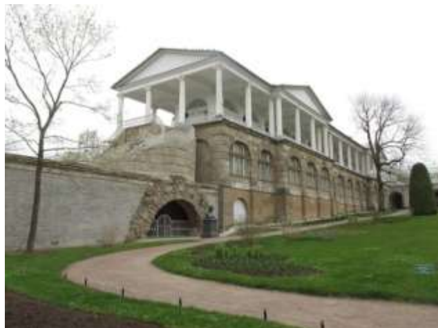
Илл. 8. Здание Камероновой галереи со стороны Фрейлинского садика