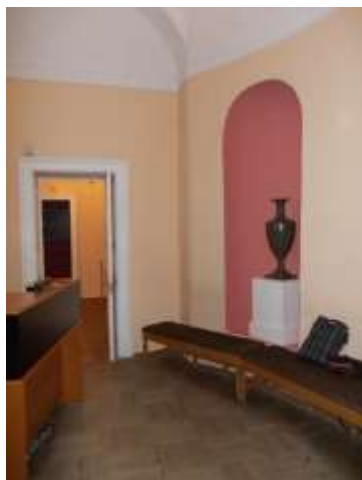
Илл. 10. Вестибюль – раздевалка