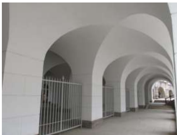
Илл. 4. Арочные проёмы и своды под Висячим садом