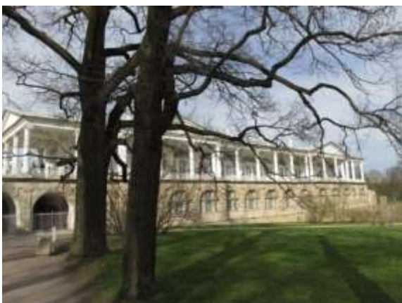
Илл. 5. Камеронова галерея. Южный фасад