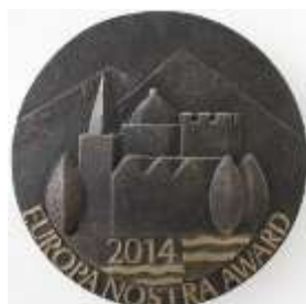
Илл. 56. Медаль за усердные труды коллективу «Царскосельской янтарной мастерской» на ниве консервации памятника истории и культуры России «Агатовых комнат» летнего паркового павильона «Холодная баня» в Царском Селе. 2014 год