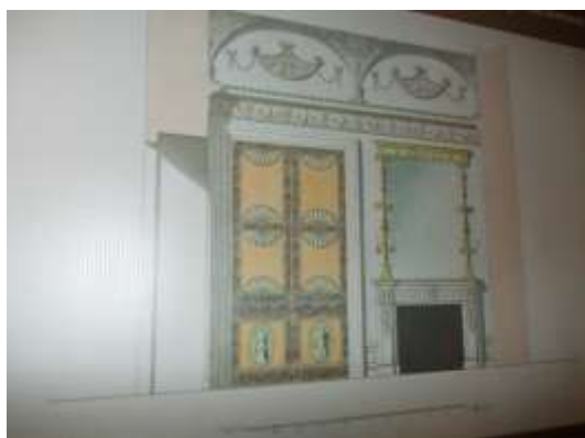
Илл. 18. Проект западной стены Библиотеки Ч. Камерона с камином на месте книжного шкафа