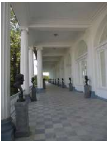
Илл. 7. Бюсты мыслителей и философов древности на открытой галерее