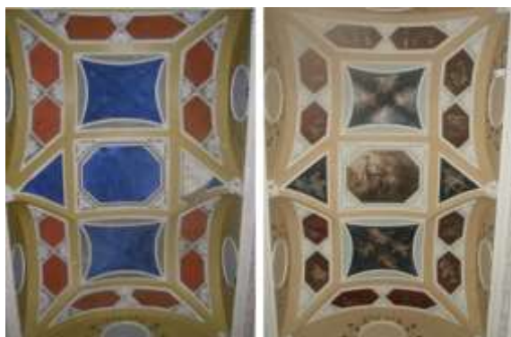
Илл. 21-22. Плафон библиотеки до реставрации. 2009 год. Плафон библиотеки после реставрации. 2010 год