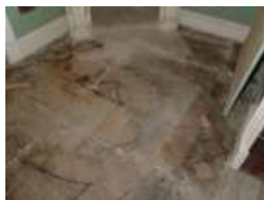
Илл. 54. Паркет Кабинетца до реставрации. 2009 год