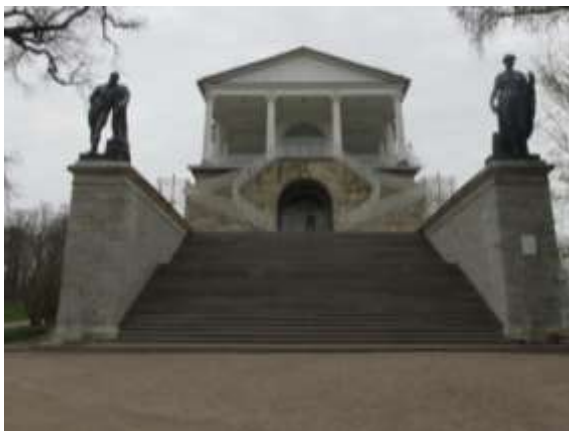
Илл. 6. Лестница «Камероновой галереи» со скульптурами Геракла и Флоры