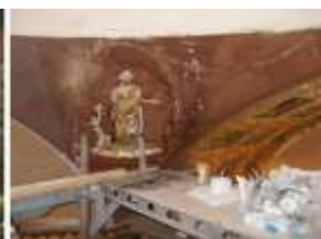
Илл. 38-39. Яшмовый кабинет. Северо-западный парус до реставрации. Парус в процессе удаления поздних красочных слоёв на фоне