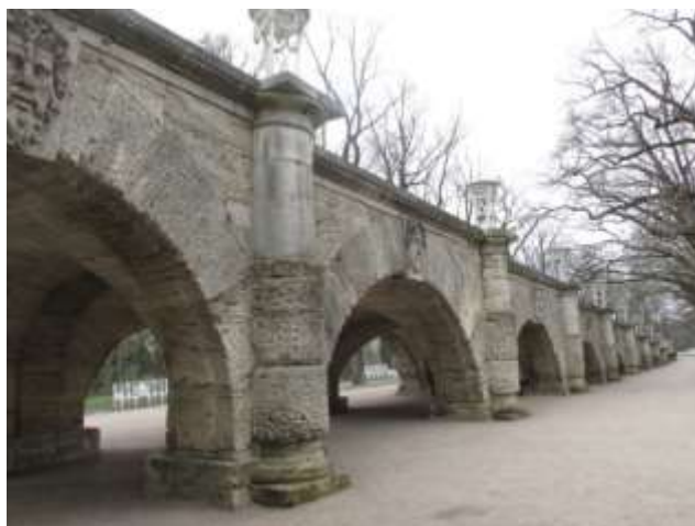
Илл. 9. Пологий спуск Пандус с Висячего сада на Рамповую аллею