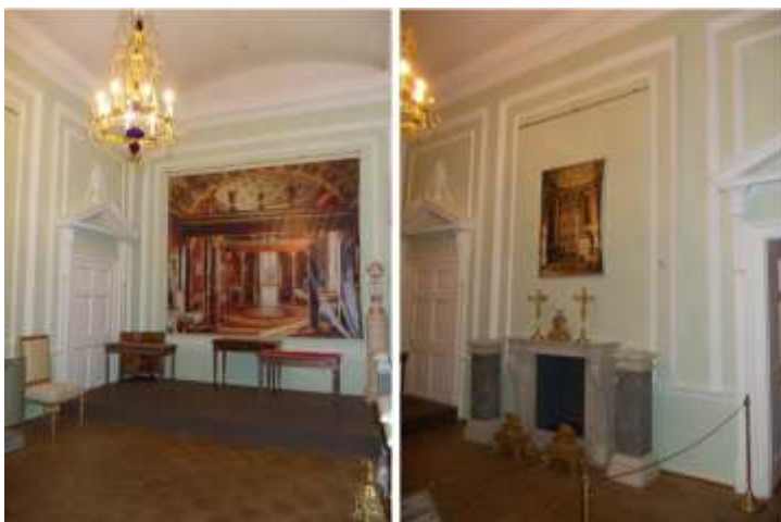
Илл. 11-12. Ванная комната с камином