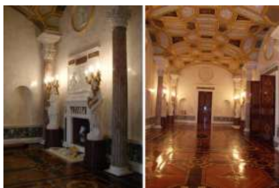
Илл. 30. Большой зал – Сферистерий после реставрации