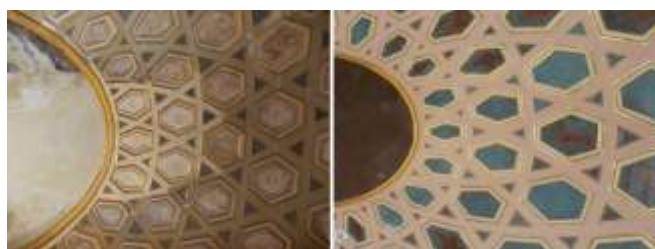
Илл. 48-49. Овальный кабинет. Воссоздание утраты штукатурного слоя плафона, лепного декора с позолотой и живописными вставками в кессонах. 2012 год