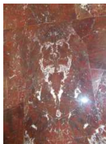
Илл. 27. Агатовый кабинет. Фрагмент яшмовой облицовки западной стены у камина с «маской Мефистофеля». 2010 год