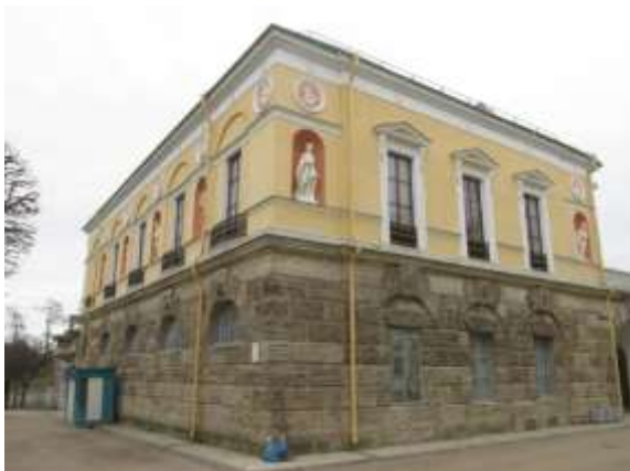
Илл. 1. Северный и западный фасады павильона «Холодная баня» со скульптурой в нишах на втором этаже