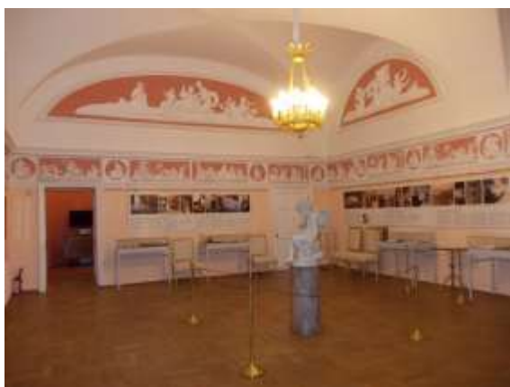
Илл. 13. Центральный зал с бассейном (бассейн не отреставрирован)