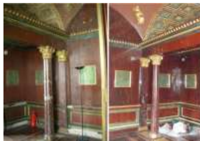
Илл. 34-35. Яшмовый кабинет (юго-восточный угол) до и после реставрации. 2009-2012 годы