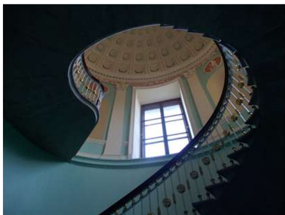
Илл. 15-16. Лестница на второй этаж. Перила верхней площадки