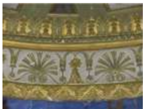
Илл. 44-45. Овальный кабинет. Фрагмент карниза после консервации и реставрации с выявленным после удаления загрязнений цветным золотом жёлтого и зелёного цветов. 2011 год