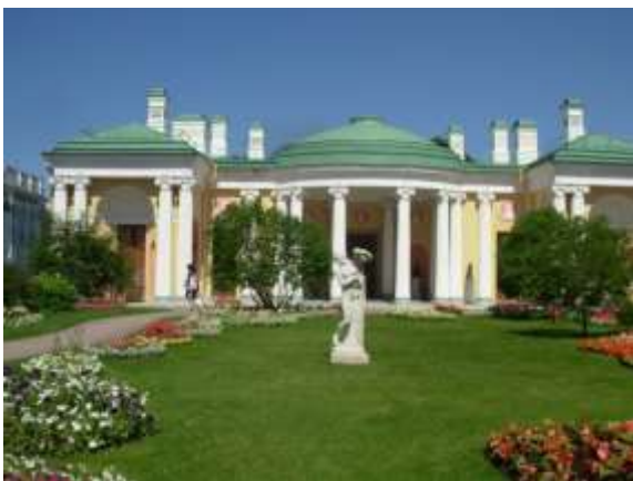
Илл. 3. Южный фасад «Холодной бани» со стороны Висячего сада