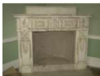
Илл. 50-51. Кабинет. Камин до и после консервации и реставрации. 2012-2013 годы