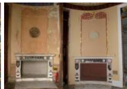
Илл. 42-43. Простенок Овального кабинета с камином до и после консервации