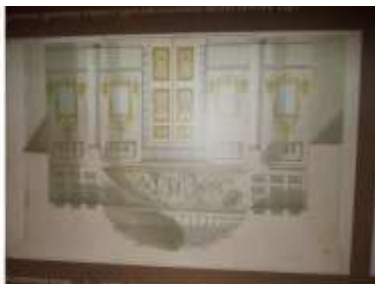
Илл. 32-33. Проекты Ч. Камерона. Яшмовый кабинет. слева – реализованный, справа – не реализованный