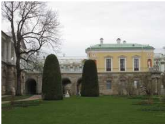
Илл. 2. Вид на «Холодную баню» со стороны Фрейлинского сада