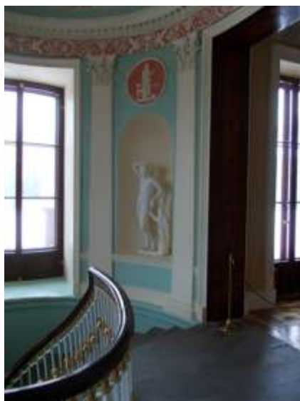
Илл. 17. Лестница на второй этаж. Верхняя площадка