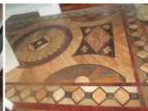
Илл. 55. Паркет Кабинетца после реставрации. 2013 год