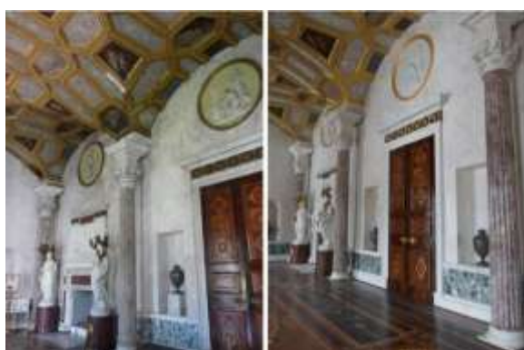
Илл. 28-29. Фрагмент южной стены Большого зала Агатовых комнат до и после консервации и реставрации всех видов отделки. 2009-2012 годы