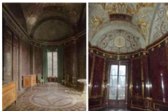
Илл. 23-24. Агатовый кабинет до и после консервации и реставрации. 2009-2010 годы