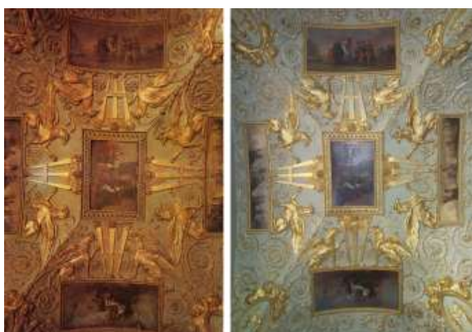
Илл. 25-26. Плафон Агатового кабинета до и после консервации и реставрации позолоты и живописи. 2009-2010 год